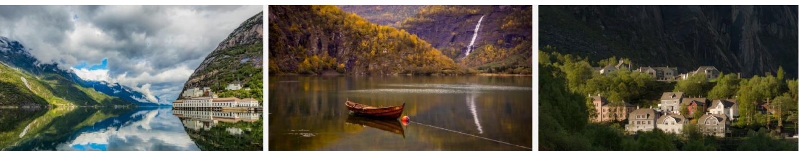
Første- til tredjeplass i den norske del-konkurransen med motiver fra Vestland. Info og nedlastingslenker nedenfor.

Pressemelding fra Wikimedia Norge, wikimedia.no , 06.03.2023.