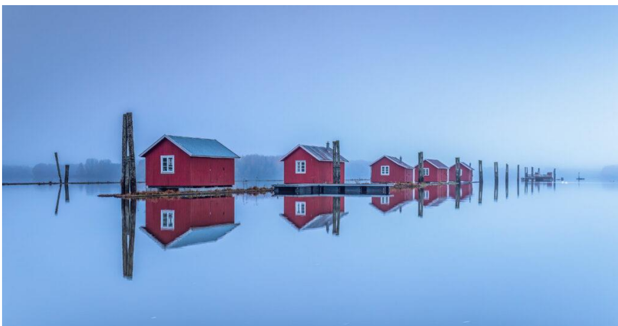
Fetsund lenser. Foto: Jarle Kvam. CC BY-SA 4.0.

Pressemelding fra Wikimedia Norge, wikimedia.no , 18.04.2023.