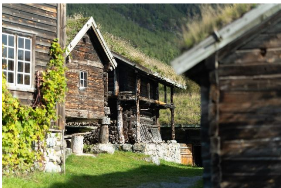
Heljegardsstabburet og Vigdalsloftet på Sogn folkemuseum.