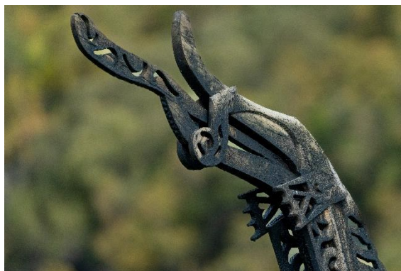
Dragehode på Borgund stavkirke.

Last ned bildet