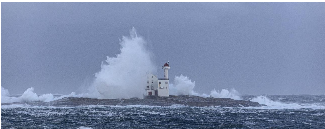
Hestskjæret fyr i storm fra nordvest, Averøy kommune.

– Bildene vekker lysten til å lære mer om motivet. Det er viktig for at bildene skal egne seg på Wikipedia.