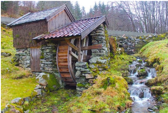
Kvernhus på Myksvoll, Alver.

Last ned bildet