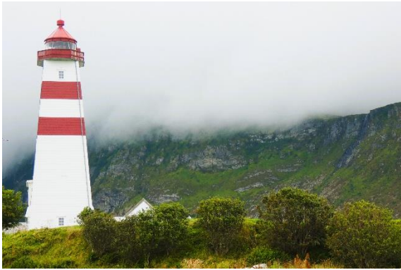
Alnes fyr på Godøya.

Last ned bildet