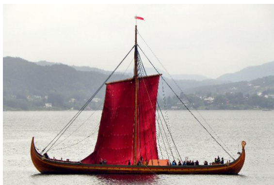
Seilet heises på Draken Harald Hårfagre ved Fjellskålnes i Osterfjorden.

Last ned bildet