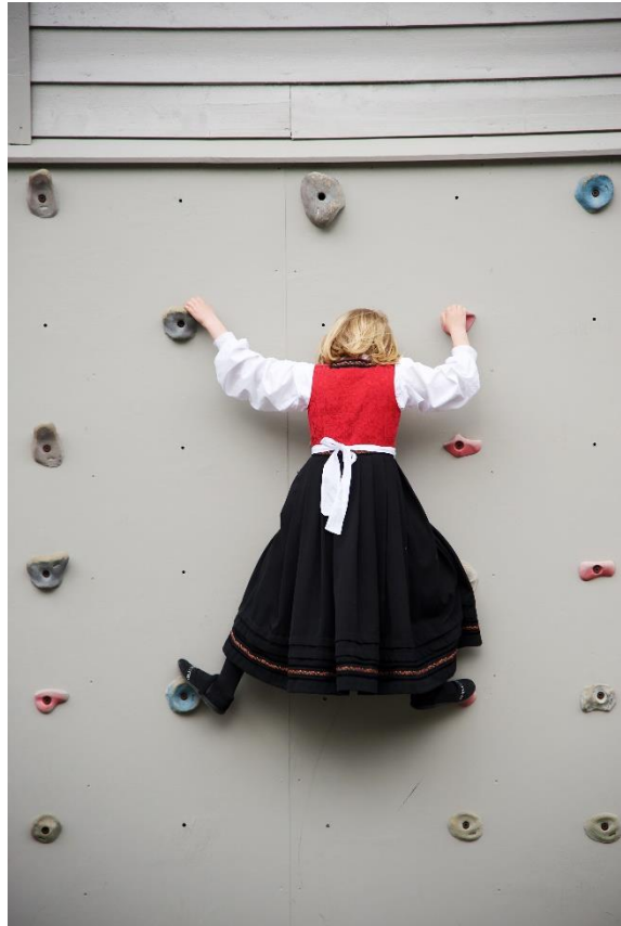
17. mai på Vikøy.

Last ned bildet